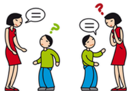
A du mal à comprendre et à se faire comprendre