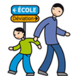
N'apprécie pas les changements