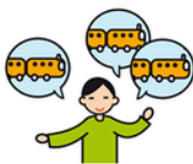
Parle de façon incessante sur un sujet particulier