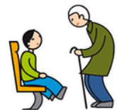
Comprend mal les conventions et les règles sociales