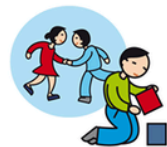
Ne joue pas avec les autres enfants