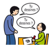
Utilise le langage de façon écholalique